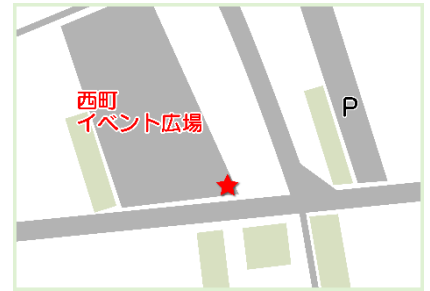
②⑱おもてなし第1駐車場