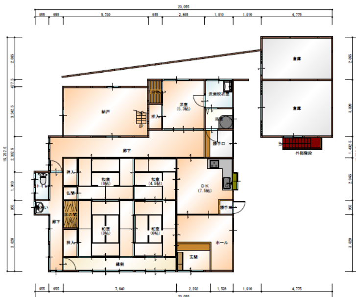
1階 平面図 S:1/150