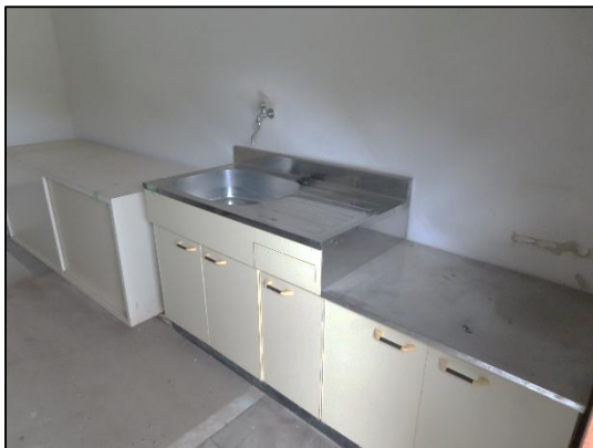
流 し 台