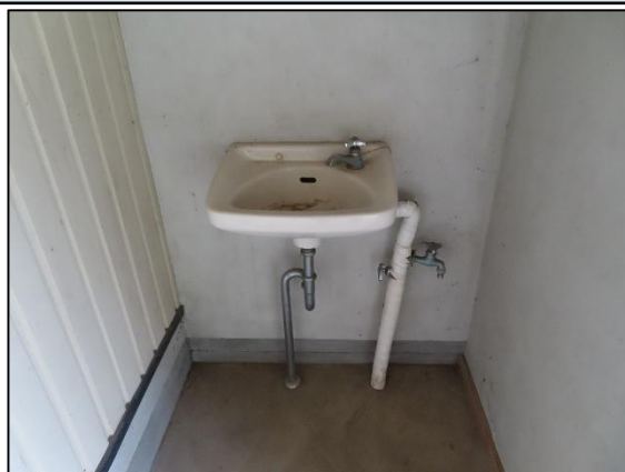
洗 面 所