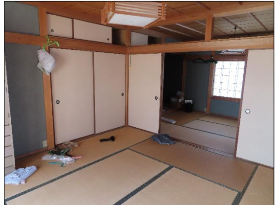
和 室 (2階)