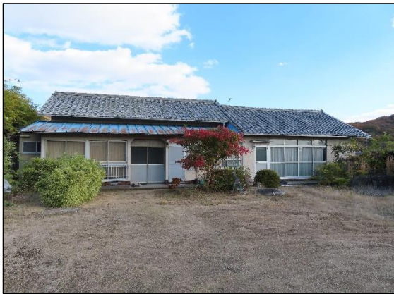
外 観 (離れ)