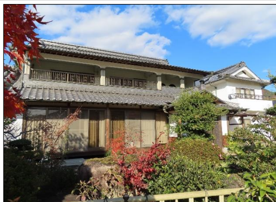
外 観 ( 母 屋 )