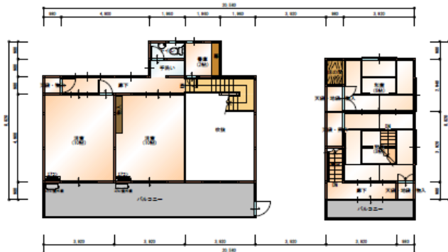
2階 平面図 S:1/200