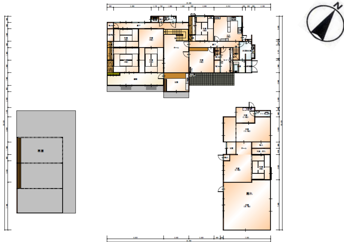
1階 平面図 S:1/200