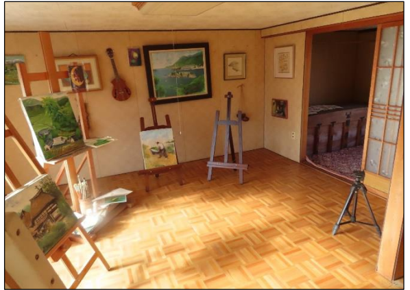
洋 室 ( 2 階 )