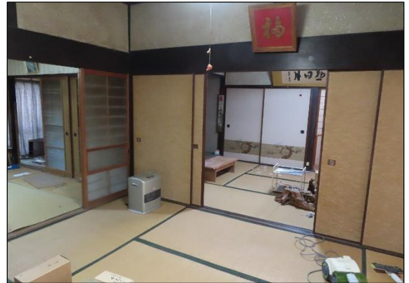
和 室 ①