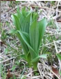
芽出し期のコバイケイソウ