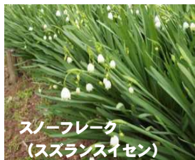
スノーフレーク (スズランスイセン)