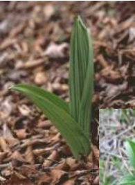
芽出し期のバイケイソウ