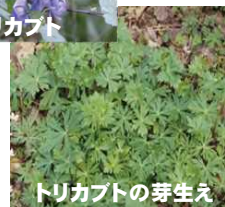
トリカブトの芽生え