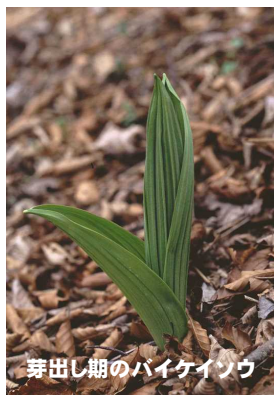
芽出し期のバイケイソウ