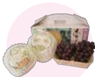
あたごなし 愛宕梨