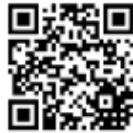
矢掛町公式ホームページ