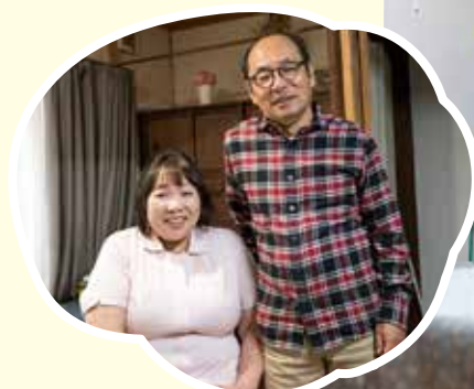
三村鍼灸院を 新規創業