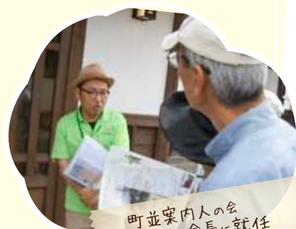
町並案内人の会 会長に就任