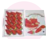
あさひめ 苺 章姫