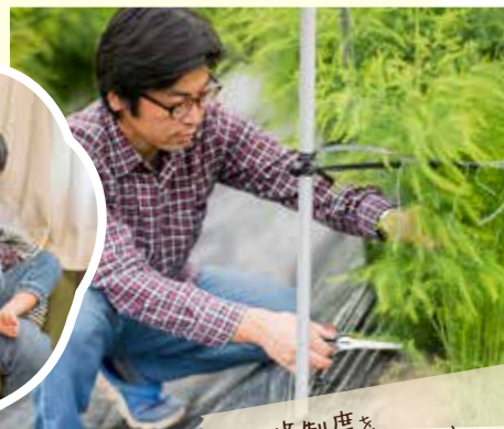
研修制度を利用して研修中