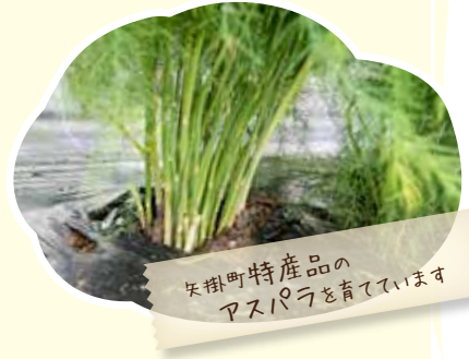
矢掛町特産品のアスパラを育てています