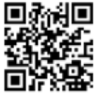
矢掛町移住支援サイト