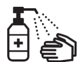
手指消毒用アルコールによる消毒の励行