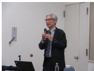
↑ 講演会の様子 ↓