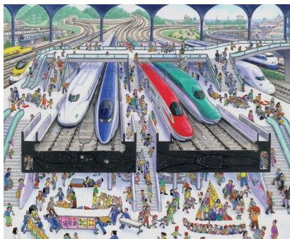
新幹線の駅 (『乗り物の迷路』より 2013年)