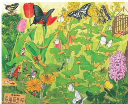
チョウの花園 (『昆虫の迷路』より 2010年)