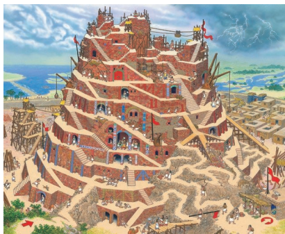
バベルの塔 (『伝説の迷路』より 2008年)